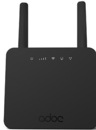
ADOC R46 router dual band