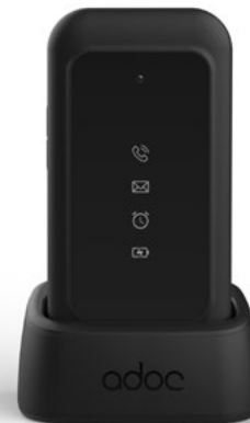
ADOC SC04 clamshell