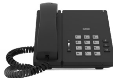
ADOC I20 ip phone