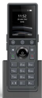
ADOC ID6 portable ip phone