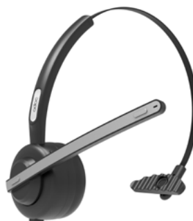
ADOC BT01 bluetooth headphones