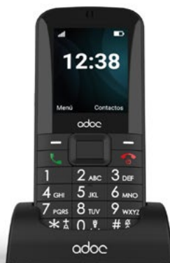
ADOC SPI senior phone