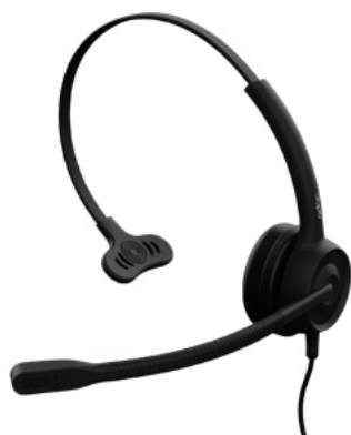
ADOC HC01 wired headphones