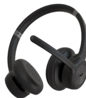
ADOC BT02 bluetooth headphones