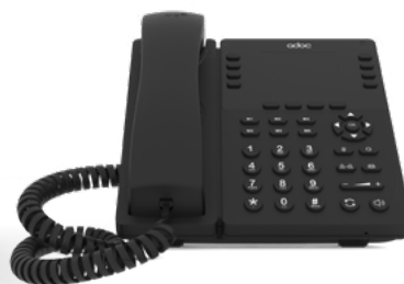
ADOC I10 ip phone