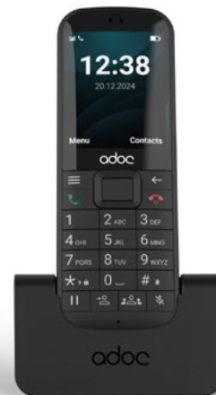
ADOC K6 wireless phone