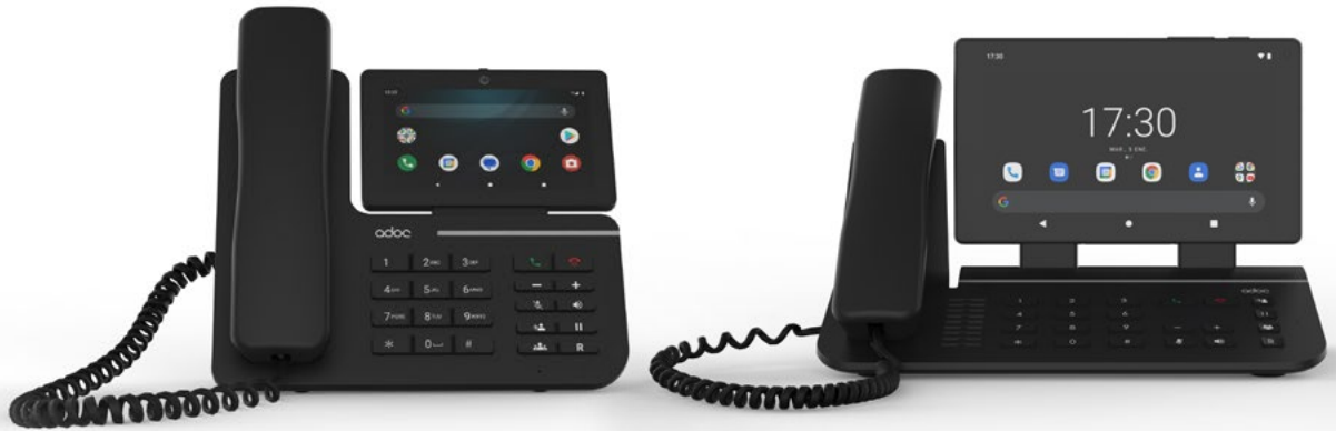
ADOC D18 fixed wireless phone