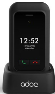
ADOC SC01 clamshell