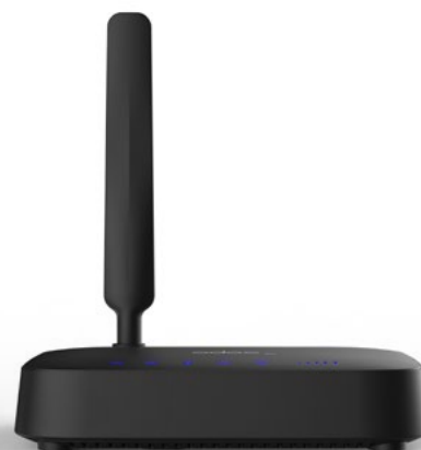
ADOC V6 voice box