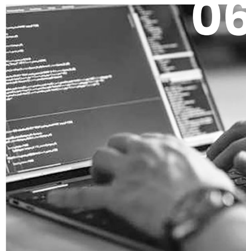
Posventa & Asistencia local After Sales & Local assistance