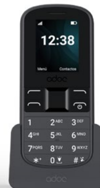
ADOC S4 feature phone