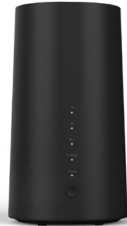
ADOC R55 router dual band