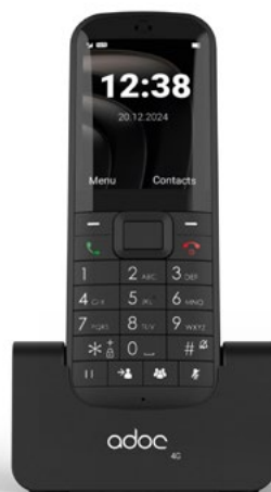
ADOC K4 wireless phone